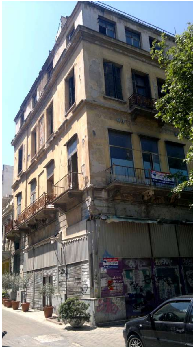
ΟΙΚΙΑ ΠΡΑΣΣΑ ΣΤΗΝ ΠΛΑΤΕΙΑ ΜΗΤΡΟΠΟΛΕΩΣ