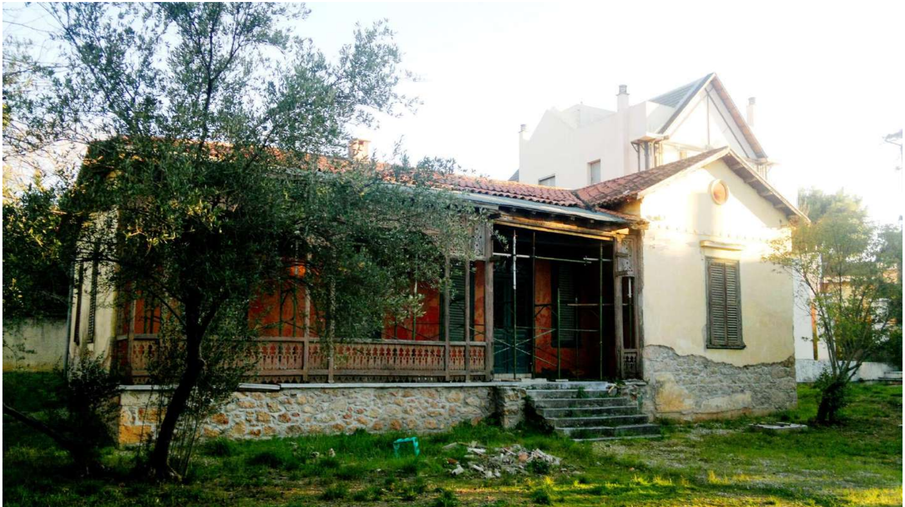
ΟΙΚΙΑ ΠΑΥΛΟΥ ΜΕΛΑ ΣΤΗΝ ΚΗΦΙΣΙΑ