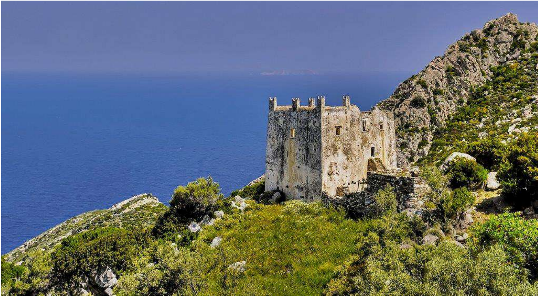
ΠΥΡΓΟΣ ΑΓΙΑΣ ΣΤΗΝ ΝΑΞΟ