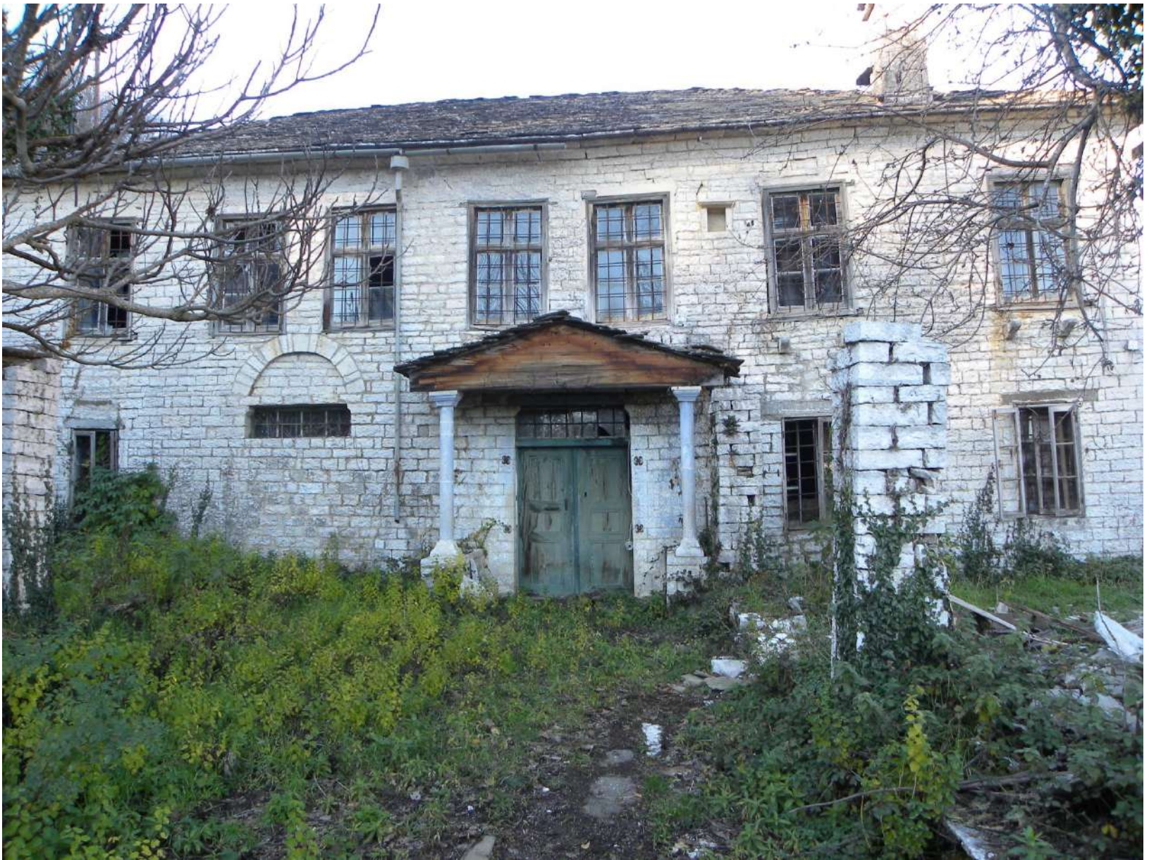
ΟΙΚΙΑ ΣΤΟ ΔΙΛΟΦΟ ΖΑΓΟΡΙΟΥ