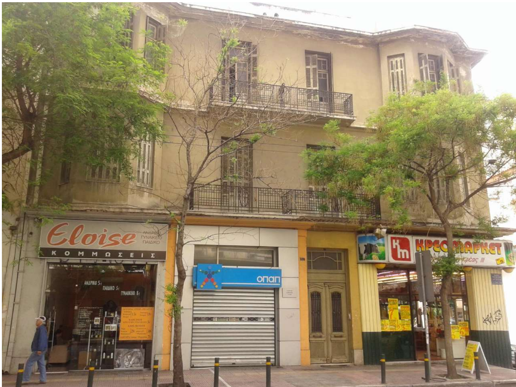
ΠΟΛΥΚΑΤΟΙΚΙΑ ΜΕΣΟΠΟΛΕΜΟΥ ΣΤΗΝ ΟΔΟ ΠΑΤΗΣΙΩΝ