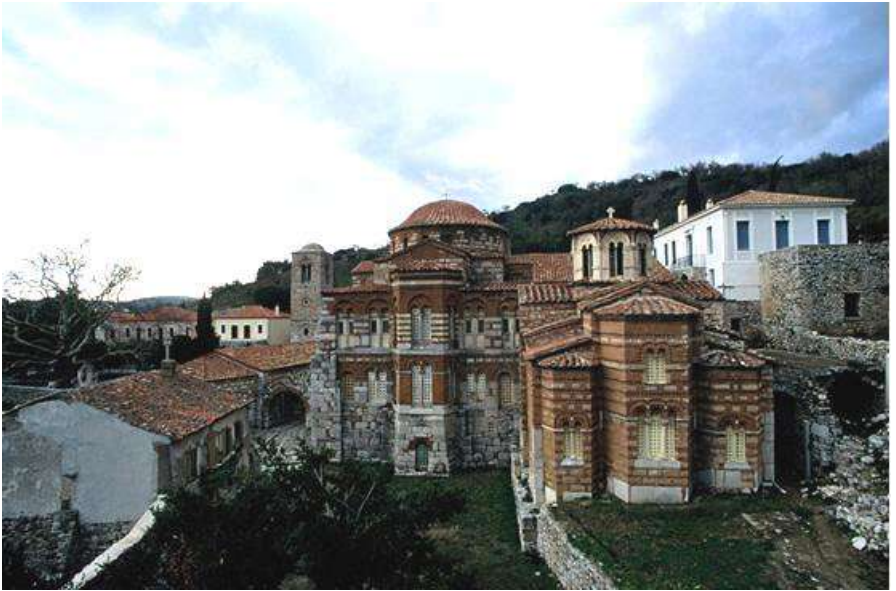
ΙΕΡΑ ΜΟΝΗ ΟΣΙΟΥ ΛΟΥΚΑ ΣΤΟ ΣΤΕΙΡΙ ΒΟΙΩΤΙΑΣ