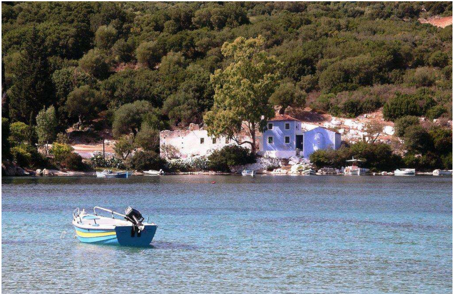
ΣΥΓΚΡΟΤΗΜΑ ΕΛΑΙΟΤΡΙΒΕΙΟΥ ΣΤΟΝ ΑΘΕΡΑ ΚΕΦΑΛΟΝΙΑΣ