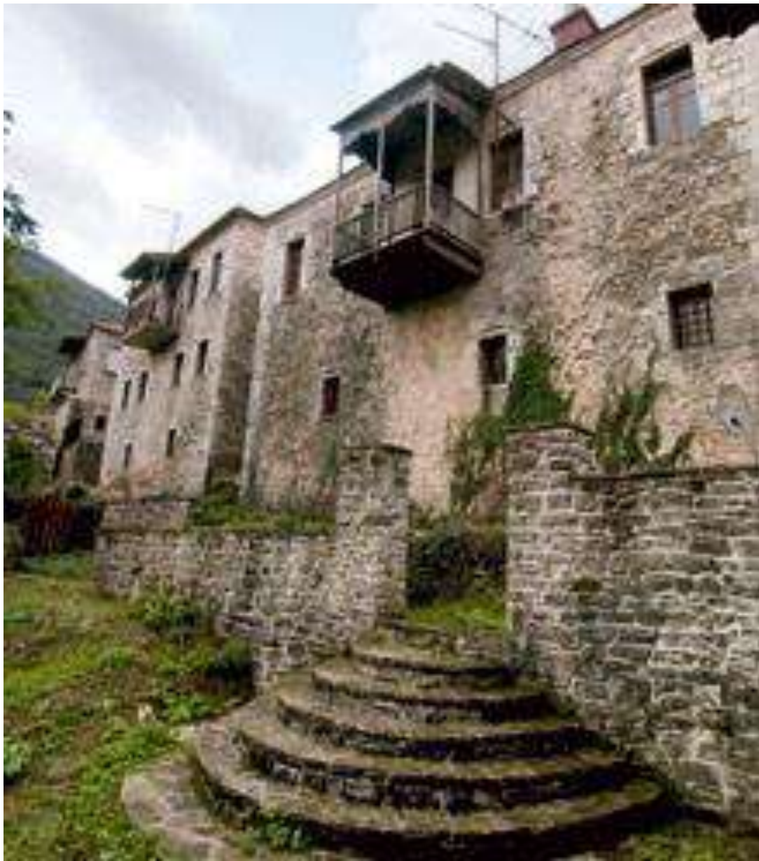
ΑΡΧΟΝΤΙΚΟ ΣΤΟ ΜΕΓΑΛΟ ΧΩΡΙΟ ΕΥΡΥΤΑΝΙΑΣ