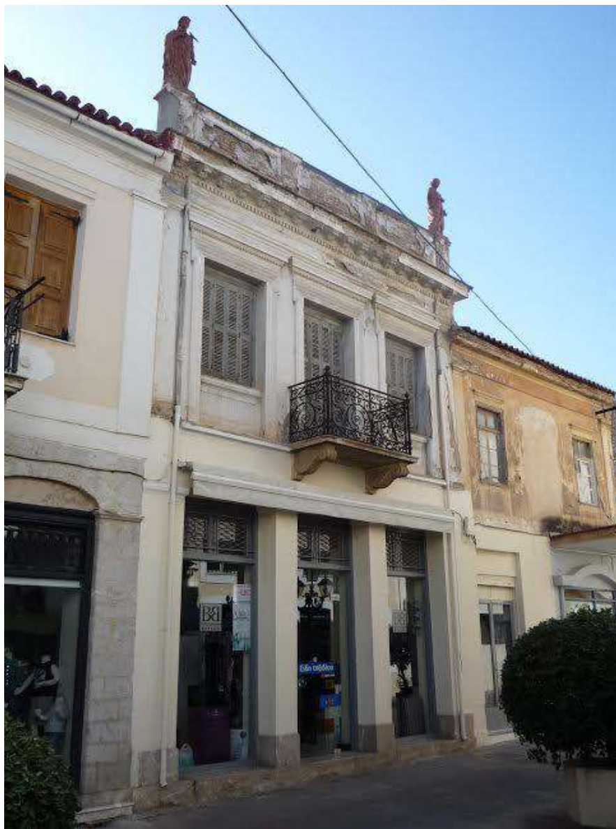
ΚΑΤΑΣΤΗΜΑ ΚΑΙ ΟΙΚΙΑ ΣΤΟ ΑΡΓΟΣ