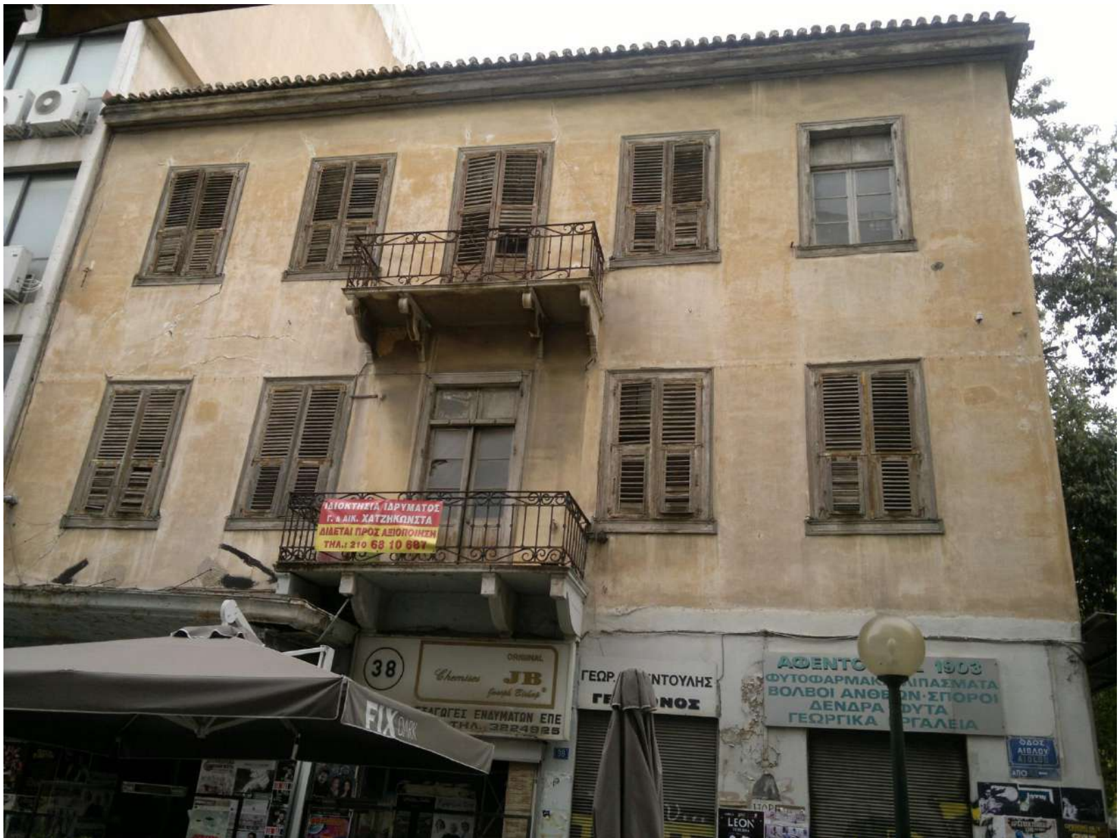
ΑΚΙΝΗΤΟ ΧΑΤΖΗΚΩΝΣΤΑ ΣΤΗΝ ΟΔΟ ΑΙΟΛΟΥ