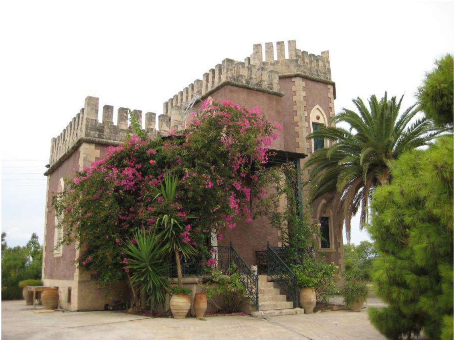
ΠΥΡΓΟΣ ΡΑΛΛΗ ΣΤΗΝ ΑΙΓΙΝΑ