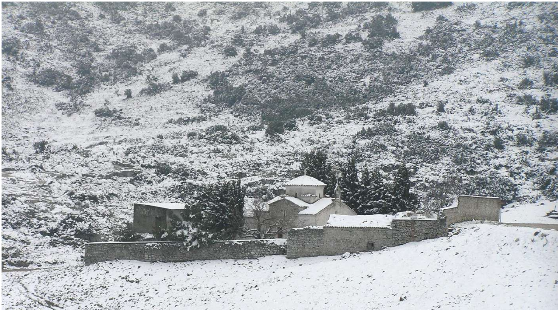
ΙΕΡΑ ΜΟΝΗ ΠΡΟΦΗΤΗ ΗΛΙΑ ΣΤΟΝ ΚΙΘΑΙΡΩΝΑ ΑΤΤΙΚΗΣ