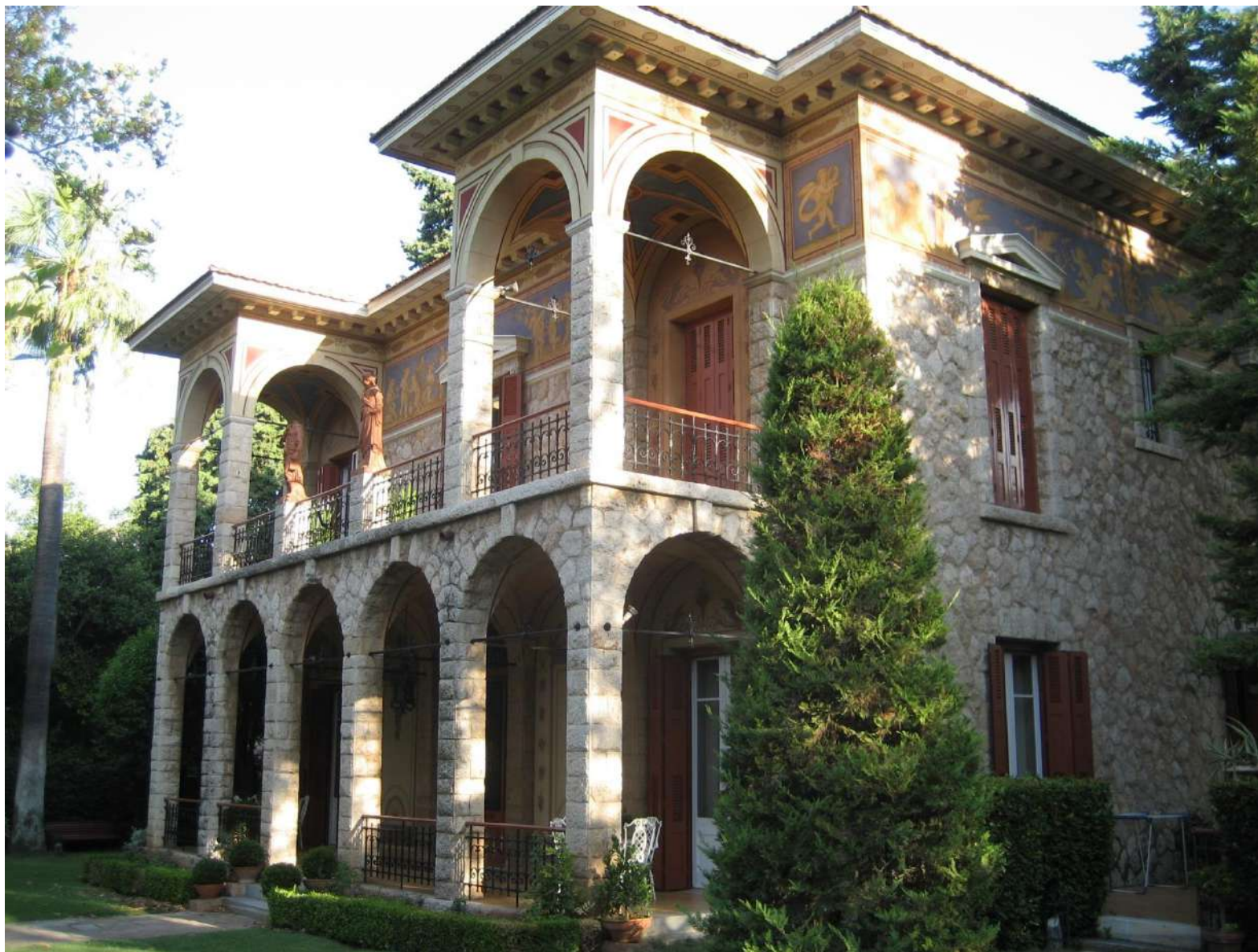
ΝΕΟΚΛΑΣΙΚΗ ΕΠΑΥΛΗ ΣΤΗΝ ΚΗΦΙΣΙΑ